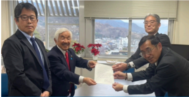
長年の活動により県農政部長並びに教育長にポニーの寄贈を要望