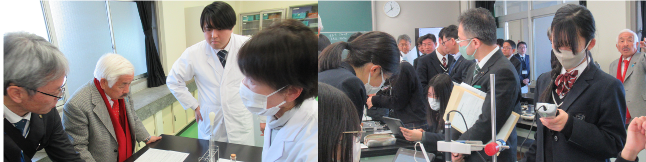
韮崎高校のスペースサイエンスハイスクールを県教育長と共に視察