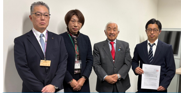
明野処分場安全管理委員会に出席