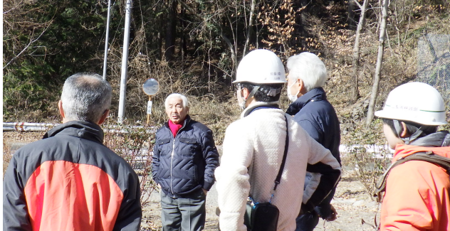
野猿返しの桜の並木づくりの要望活動（長坂町・武川町）