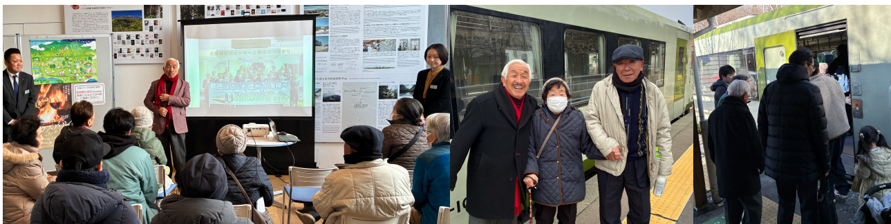
ハケ岳南麓エリア活性化協議会で小海線の一体的な地域振興