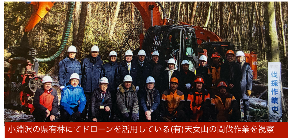
小淵沢の県有林にてドローンを活用している(有)天女山の間伐作業を視察