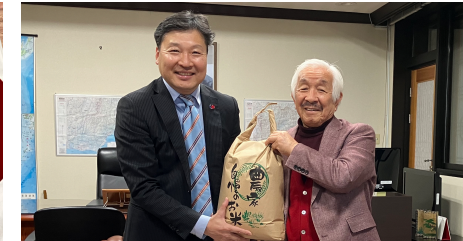
在日韓国総領事館にて民間交流の促進について副総領事に表敬訪問