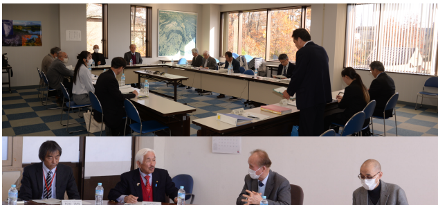
市の文化財保存活用のための協議会にて意見を述べました。