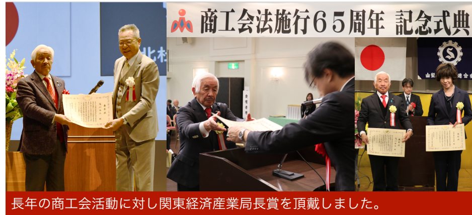
長年の商工会活動に対し関東経済産業局長賞を頂戴しました。

事業内容 専門家によるDX・デジタル化の伴走支援 社内DX推進人材育成のためのワークショップの開催