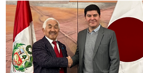
ペルー大使館にて国際交流の表敬訪問