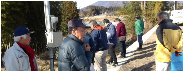
長坂町大久保地区の要望による現地調査（秋山、浅川両市議同行）