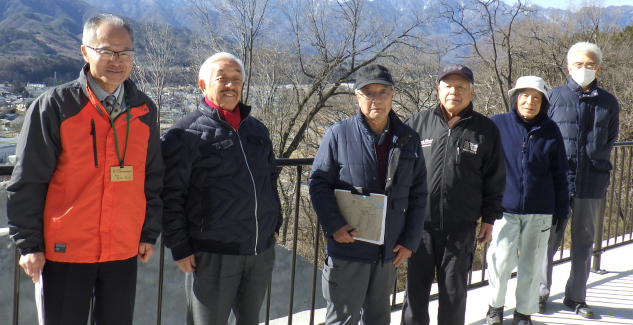
北杜市明野町浅尾区自治会から、県への土砂埋立て事業に関する要望活動に同行