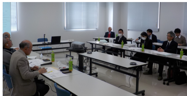
明野処分場安全管理委員会に出席