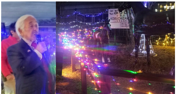
小淵沢駅のイルミネーション点灯式にて挨拶