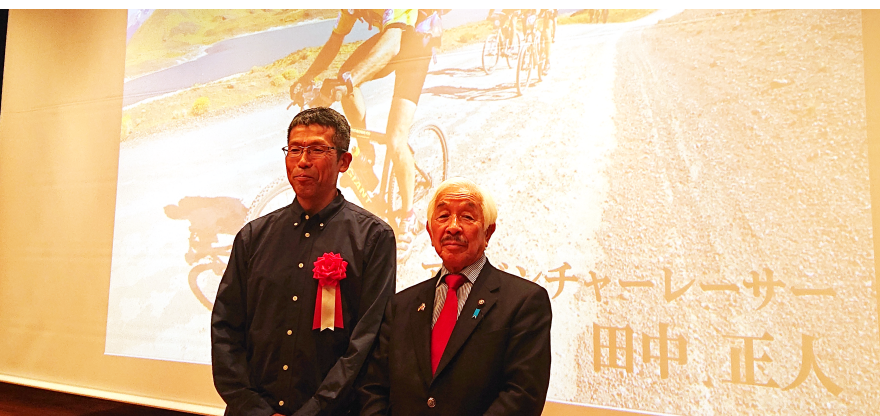
参加者が約500名！秋の旧甲州街道を歩こうに参加！