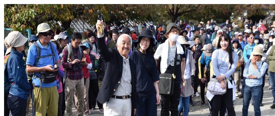
参加者が約500名！秋の旧甲州街道を歩こうに参加！