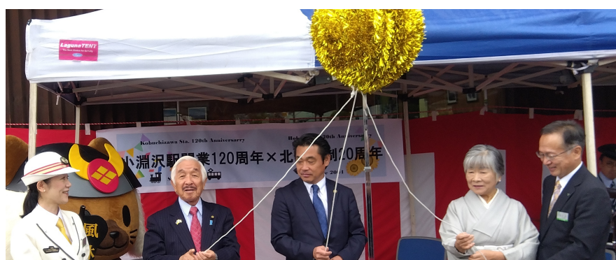
JR小淵沢駅開業120周年×北杜市制20周年記念イベントに参列、祝辞を述べさせていただきました。