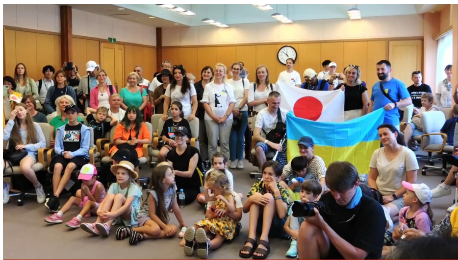
日本に避難しているウクライナの子供たちとその家族を北杜市サンフラワーフェスにご招待、楽しい時を過ごせました。