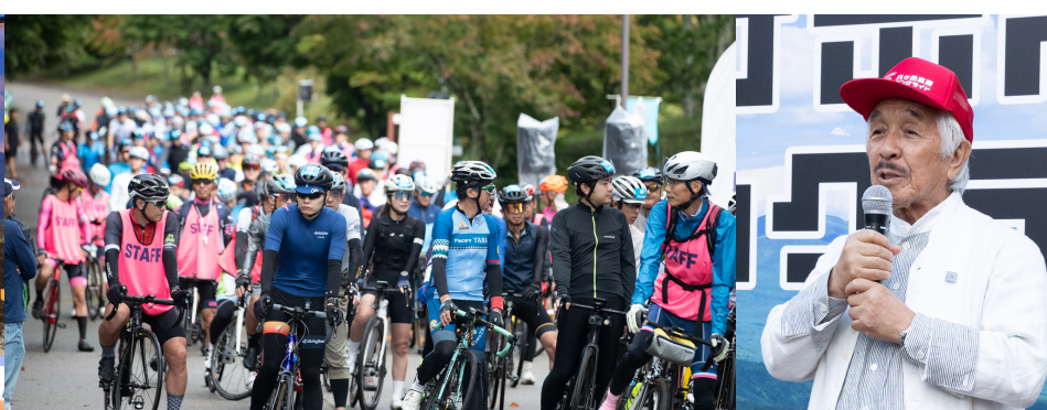
馬術競技上にて早朝の環境整美に参加しました。