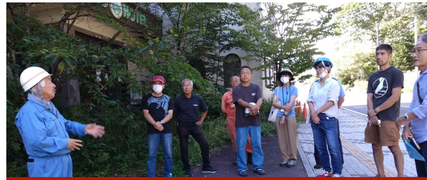
清里の地域の皆さまと駅前の景観安全対策のため現地調査を行いました。（旧カインドホテル）