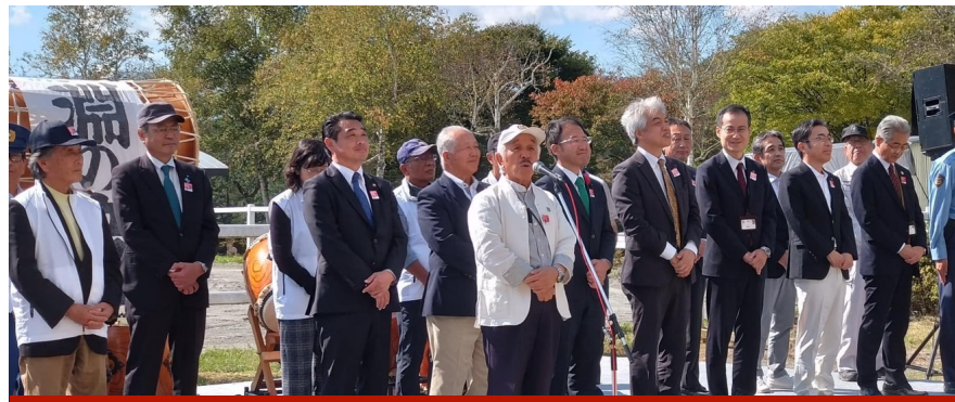
ほくと馬のまち祭り2024～信玄棒道ウォーク～大会会長として約500名の参加者にご挨拶しました。