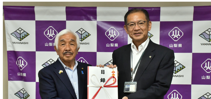
富士ヒルクライム大会会長として寄付金を山梨県に贈呈