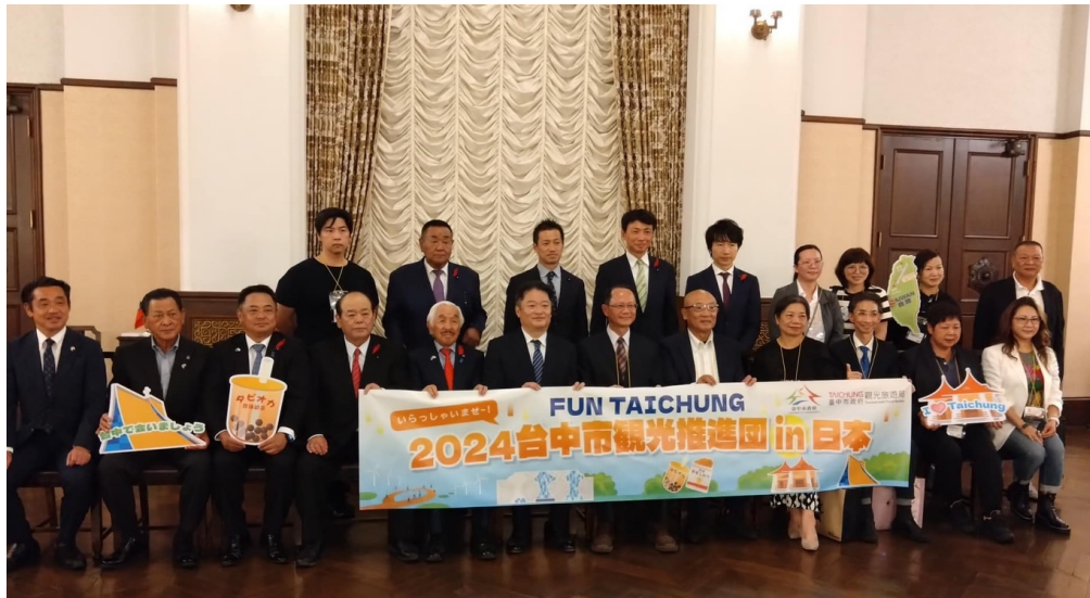
台中市観光推進団の表敬訪問を受けました。長崎知事や上村北杜市長も参加し振興を深めました。