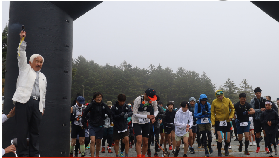
第9回 ハケ岳トラバース ロード&トレイルランニングレースを開催し、約200名のランナーが参加しました。