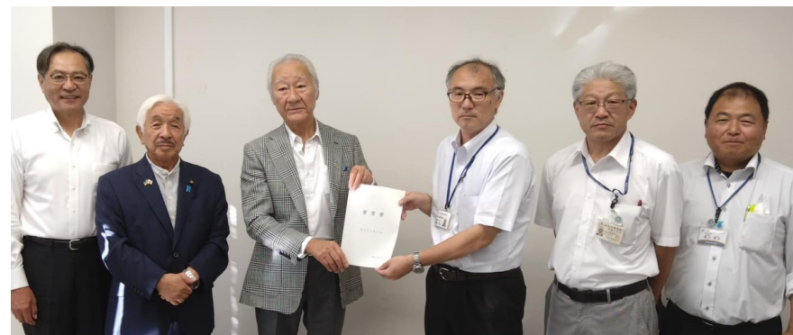
尾白川公園駐車場についての要望書を富士川砂防に提出しました。