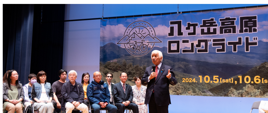
10月5日・6日に八ヶ岳高原ロングライド&グルメライドを450名のエントリーで主催しました。