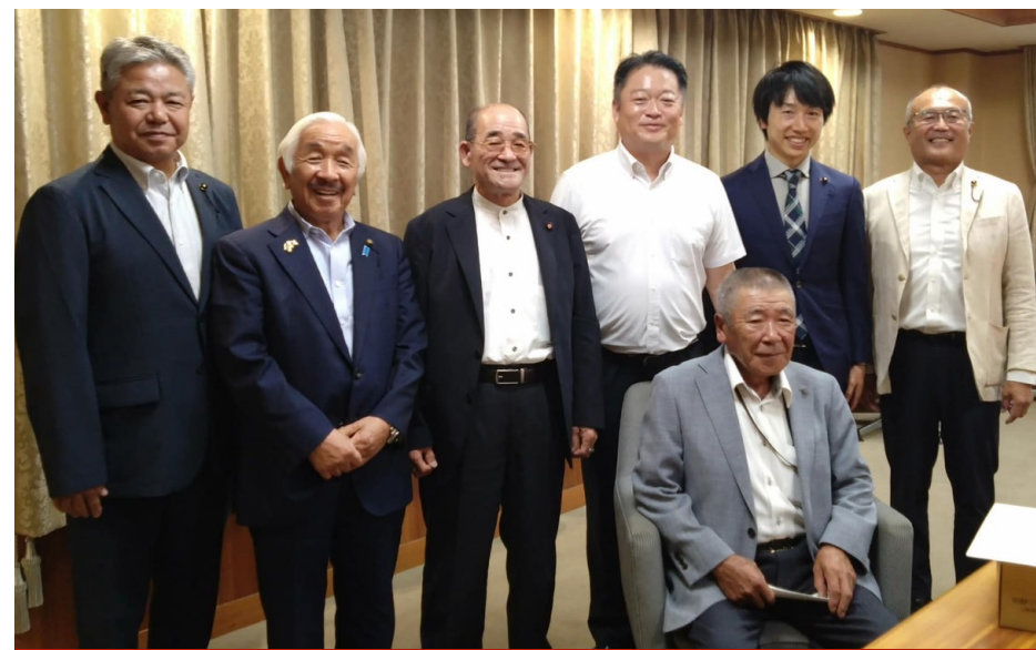
猟友会の皆さまと長崎知事に要望書を提出