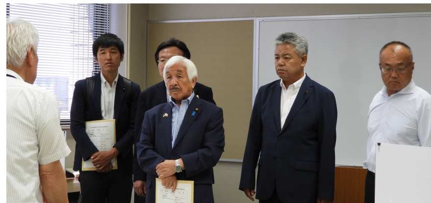
出資法人特別委員会委員長として現地調査を実施