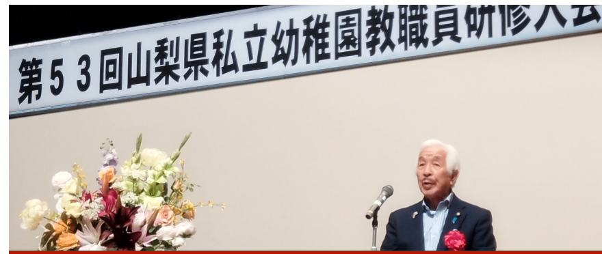
第53回 山梨県私立幼稚園教職員研修大会・永年勤続者表彰式にて激励の挨拶