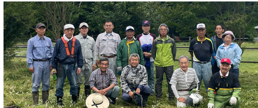
馬術競技上にて早朝の環境整美に参加しました。