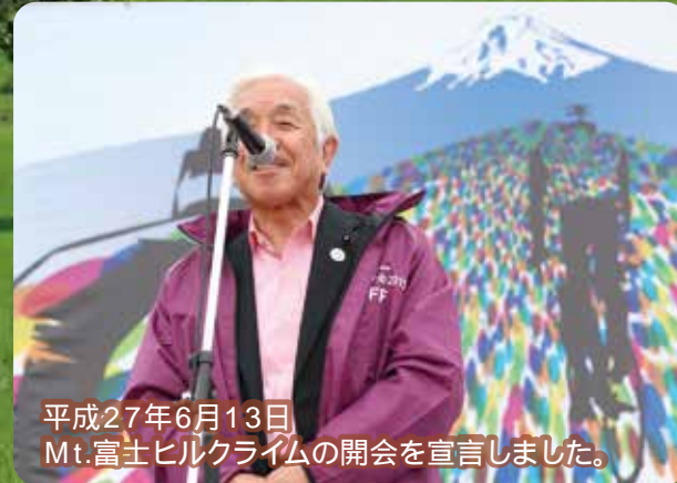
平成27年6月13日 Mt.富士ヒルクライムの開会を宣言しました。