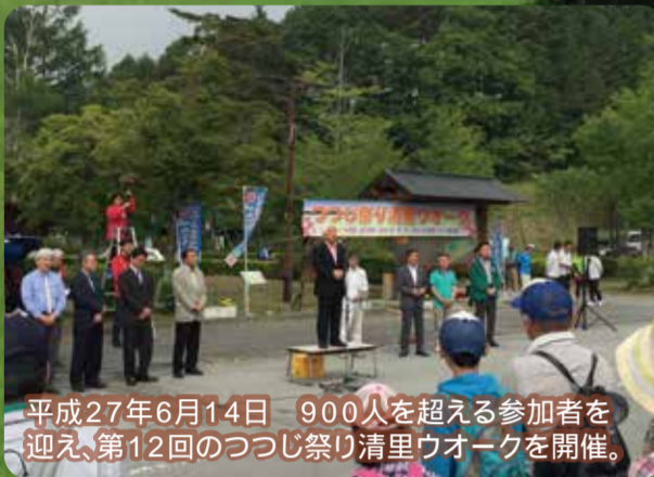
平成27年6月14日 900人を超える参加者を迎え、第12回のつつじ祭り清里ウォークを開催。

ホームページアドレス http://www.asakawa-rikizo.net