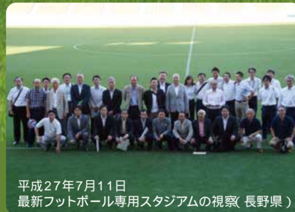
平成27年7月11日 最新フットボール専用スタジアムの視察(長野県)