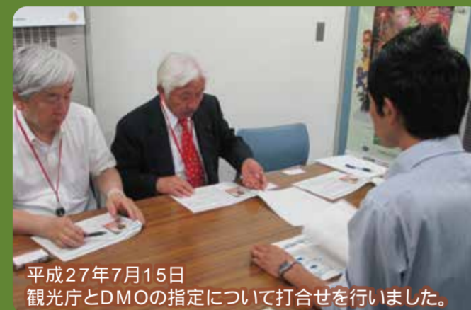
平成27年7月15日 観光庁とDMOの指定について打合せを行いました。