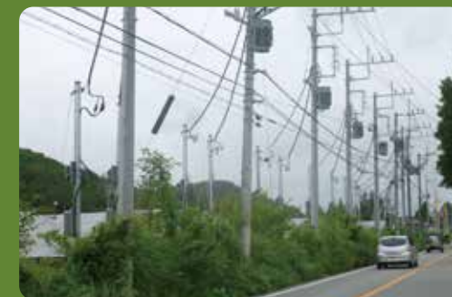
・北杜市高根町村山東割(ルート141)