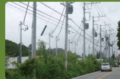
・北杜市高根町村山東割(ルート141)