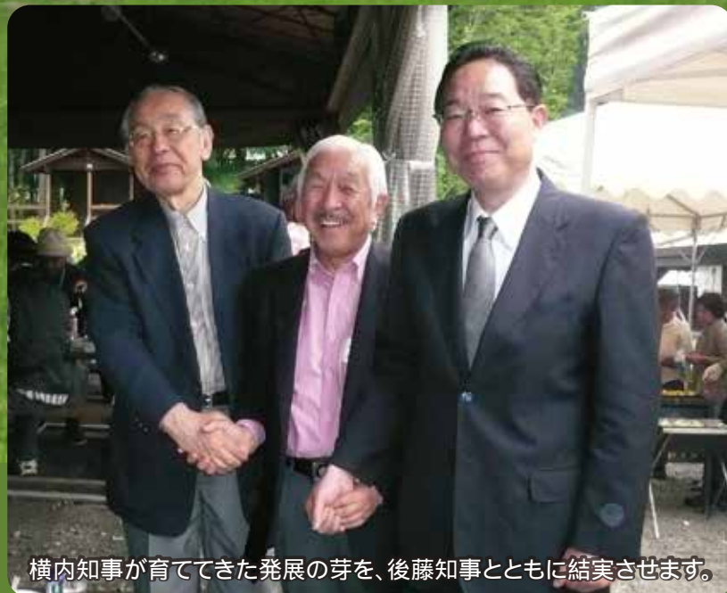
横内知事が育ててきた発展の芽を、後藤知事とともに結実させます。