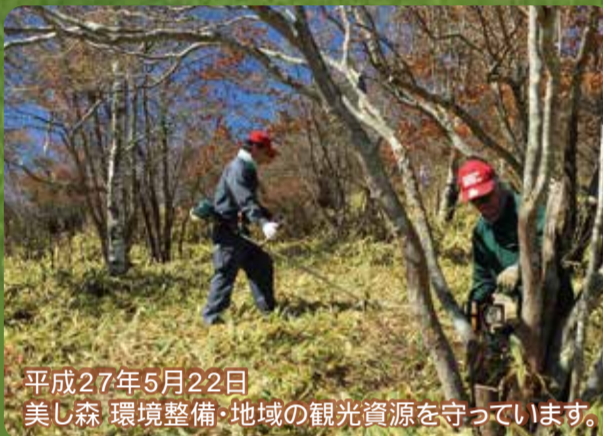
平成27年5月22日 美し森 環境整備・地域の観光資源を守っています。