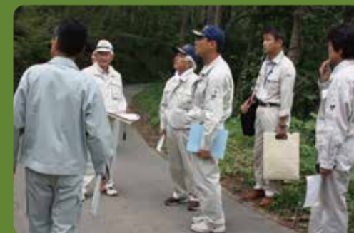
・北杜市高根町下黒澤