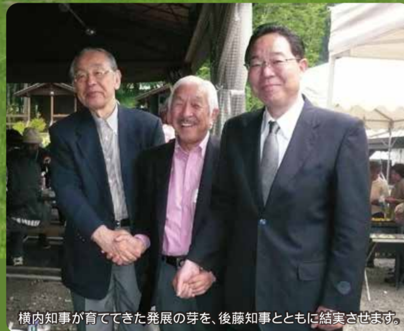
横内知事が育ててきた発展の芽を、後藤知事とともに結実させます。