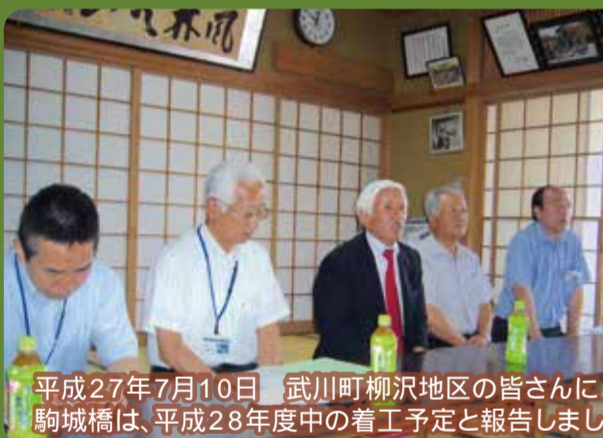
平成27年7月10日 武川町柳沢地区の皆さんに駒城橋は、平成28年度中の着工予定と報告しました。