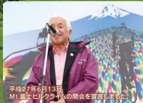
平成27年6月13日 Mt.富士ヒルクライムの開会を宣言しました。