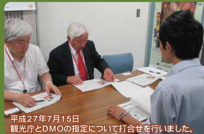
平成27年7月15日 観光庁とDMOの指定について打合せを行いました。