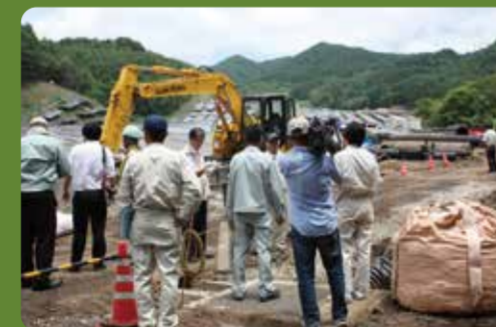
・クリーンエナジー清里の杜太陽光発電所